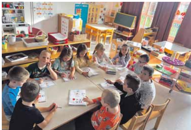
Radoboj 4kids-NTC radionice

ke u Radoboju, jedinstvene ponude u Hrvatskom zagorju, ujedno i prve kontinentalne destinacije koja je počela s provođenjem šumske kupke. Ovdje bih još spomenuo da se kontinuirano tijekom 10. mjeseca obilježava Dan općine Radoboj, manifestacija koja također okuplja veliki broj ljudi na zabavnim, edukativnim, izložbenim i drugim aktivnostima koja su namijenjene svim mještanima Općine Radoboj i šire.