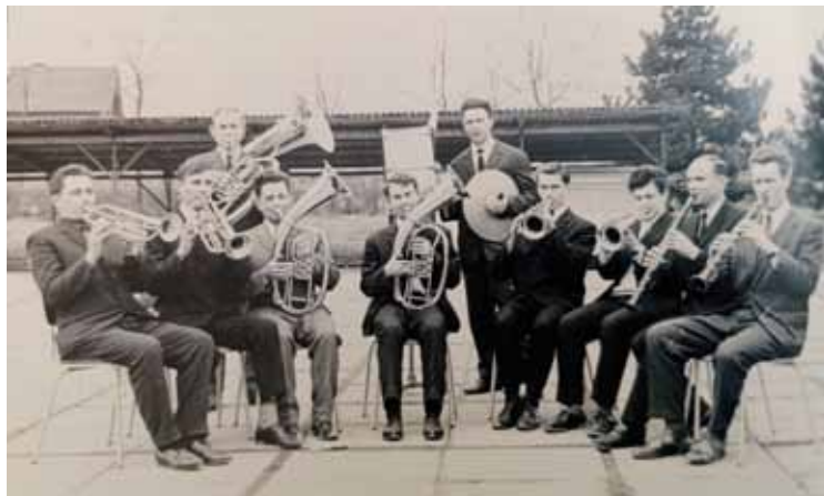
Članovi limene glazbe Mladi Radobojski snimljeni 1979. godine u vrijeme kada su snimili prvu gramofonsku ploču

ne dječji orkestar limene glazbe koji je svojim nastupima kako na području tadašnje općine Krapina tako i u mno-