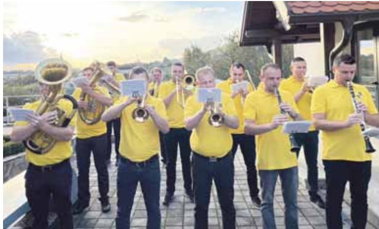
Tradiciju limenih glazbi u Radoboju nastavljaju članovi Puhačkog orkestra Radboa koji djeluje u okviru KUD-a Zagorec Radoboj