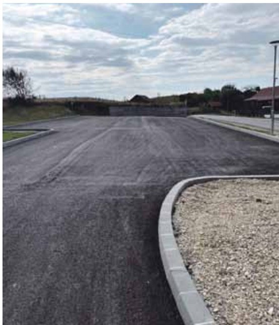
Asfaltirano parkiralište na Bregima Radobojskim