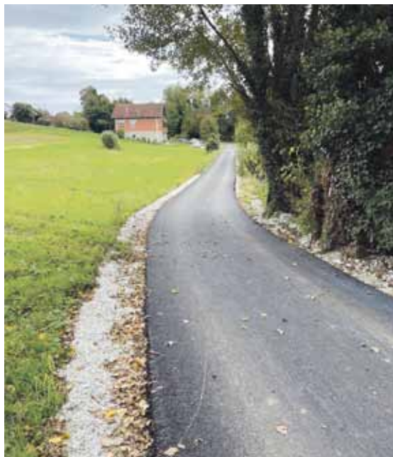
Asfaltirana nerazvrstana cesta - odvojak Kuhti

Početkom travnja, Općina Radoboj prijavila je projektni prijedlog ulaganja u opremanje nogometnog igrališta, u partnerstvu s općinskom Sportskom zajednicom i Nogometnim klubom "Radoboj", na natječaj Hrvatskog olimpijskog odbora - Aktivna zajednica u 2024. godini. Projekt je prihvaćen i ostvario je maksimalan iznos sufinanciranja u iznosu 15.000 EUR, a sveukupni iznos projekta bio je 50.512,50 EUR. Općina je financirala većinski dio projekta, odnosno 35.512,50 EUR. Projekt se odnosio na ulaganja u opremanje i održavanje sportskih terena, zatim na nabavku kosilice za travu, nogometne mreže, klupa za rezervne igrače, sjedalice s naslonom, a nabavila su se i ugradila nova rasvjetna tijela na nogometnom igralištu. Ukupno gledajući, ulaganje u infrastrukturu nogometnog igrališta, ne samo da je poboljšalo kvalitetu sportskih aktivnosti, već je i osiguralo sigurnost korisnika i gledatelja te pridonijelo boljem iskustvu svih koji koriste ili posjećuju to područje. Sva potrebna oprema unaprijedila je sport u zajednici i sportski teren, a također je doprinijela i stvaranju boljih uvjeta za rad s djecom, koji su najbrojniji ko-