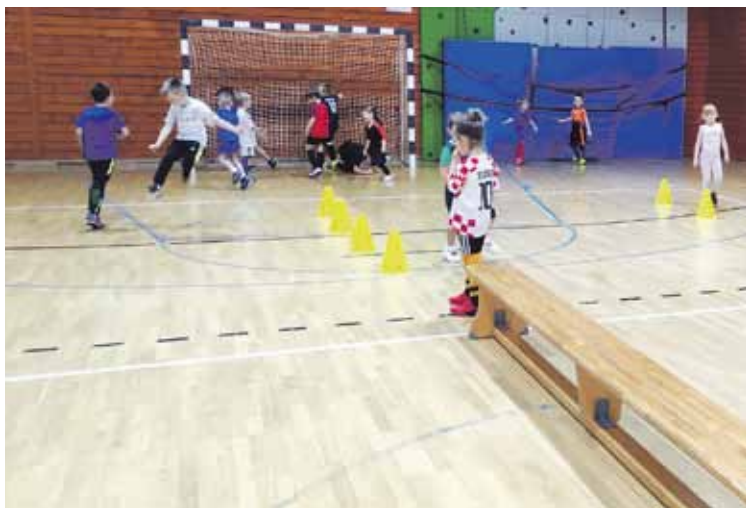
Sportska akademija za najmlađe