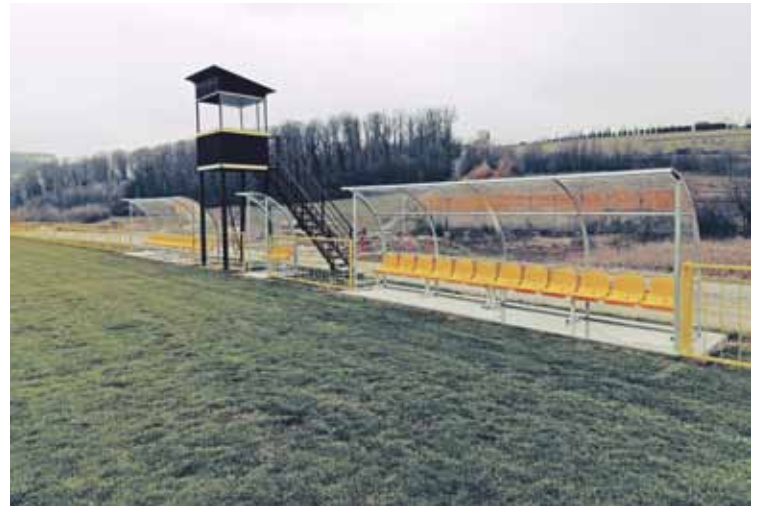
Opremanje nogometnog igrališta

Ove godine smo po drugi puta napisali i natječaj za Participativni proračun za mlade, što je uspješan mehanizam identificiranja i ostvarenja potreba mladih. Njime lokalna samouprava bolje odgovara na njihove potrebe, promiče demokratsku i socijalnu uključenost te osigurava učinkovitiju potrošnju proračunskih sredstava. Na natječaj za Participativni proračun za mlade Općine Radoboj 2024. godine pristigle su dvije prijave i one su obje na temelju prijedloga Povjerenstva odobrene za financiranje i realiziranje u ovoj godini. Prvi odobreni projektni prijedlog pod nazivom "Zelena učionica" prijavila je Lucija Pospiš. Projekt se odnosi na unaprjeđenje osnovnoškolskog obrazovanja i nastavnog procesa u prirodnom okruženju, na svježem zraku, čime bi se povećala motivacija učenika, i u konačnici opći uspjeh. Projektom će se do kraja ove godine nabaviti klupe i stolovi i postaviti kod OŠ Side Košutić Radoboj koji će biti u funkciji vanjske učionice. Drugi odobreni projekt Luke Cerovečkog pod nazivom "Moj ormarić, moj prostor" za cilj ima nabavku garderobnih ormarića OŠ Side Košutić za sve učenike od 1. do 8. razreda. Projektom će se učenicima osigurati sigurno i organizira-